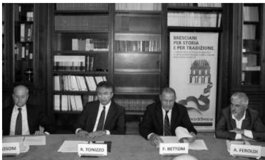
TAVOLA ROTONDA AIPOL