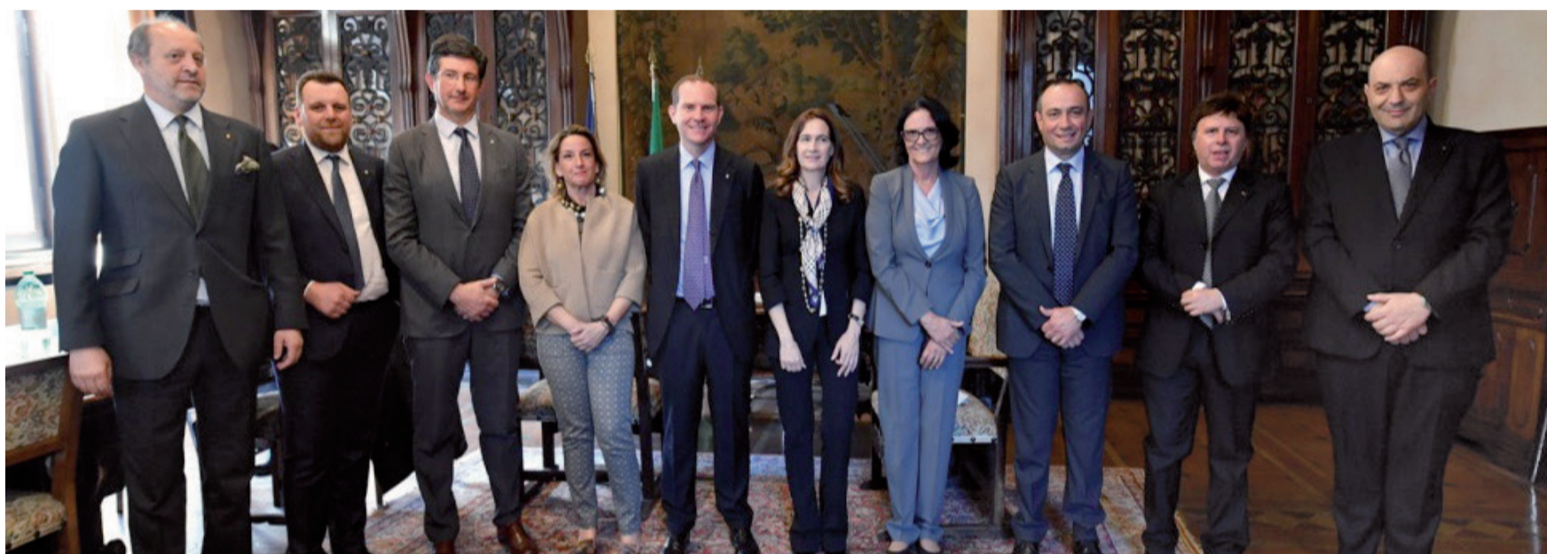
I componenti della giunta esecutiva con il nuovo presidente Massimiliano Giansanti

"Dobbiamo avere l'ambizione di diventare il punto di riferimento della filiera agroalimentare - ha spiegato ancora il nuovo presidente -, una sfida che ci dovrà portare a conquistare spazi nuovi: la costruzione di un network con partner strategici al fine di sviluppare l'attività dell'a-