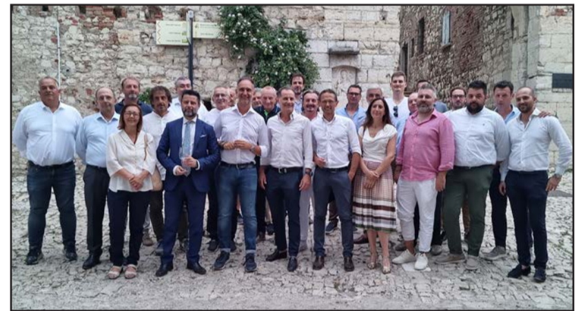
Foto di gruppo in Castello